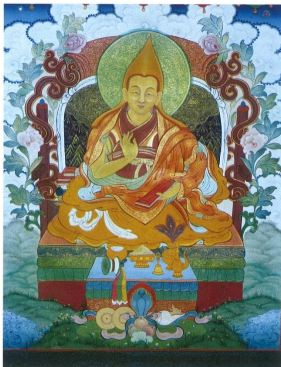
Хүрээ хамба номун хан Агваанхайдүв. (1779-1838)

“Шашин амьтны тусыг үйлдэхэд өндөр суудал, үлэмж баян хөрөнгө зоорь, өнөр олон шавь, өнгө хээмсэг нэр цол хэрэггүй, харин хэн ухаантай бол болох нь тэр”